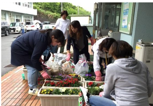
5月 花植えに協力してくださったみなさま