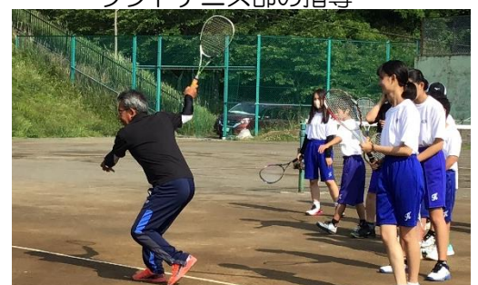
ソフトテニス部の指導