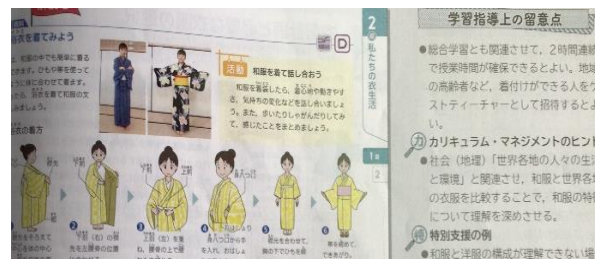
家庭科の教科書「浴衣を着てみよう」