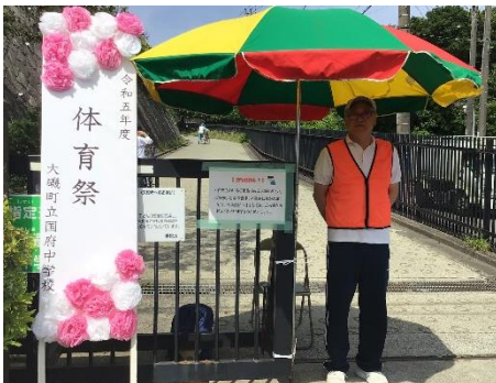
5月 シルバー人材センターの方（体育祭）

行事や総合的な学習にて、地域の方や関係者にお世話になったり、部活動の練習では専門的な指導をしていただいたりしました。国府中学校のために、多方面で、多くの方が力を貸してくださっていることに、心より感謝申し上げます。