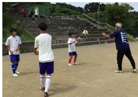
サッカー部の指導