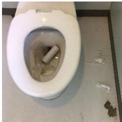
ある日の残念な様子

生徒の清掃とともに、トイレ清掃の方が、週2回、お一人で、全校のトイレを手作業できれいにしてくださっています。ありがとうございます。