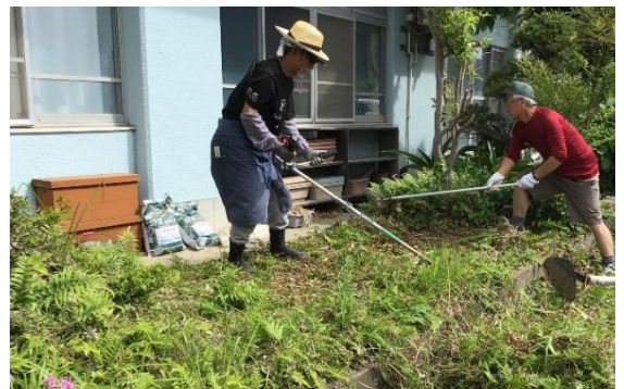
5月 近隣にお住まいの方（ふれあい級の畑）