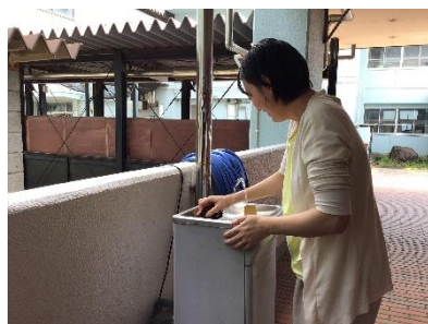
週2回、ひとりで全校すべてのトイレを、 手作業できれいに