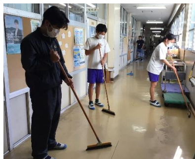
清掃をしている生徒のみなさん