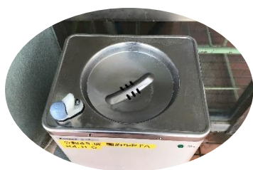
冷水機をピカピカに

学校生活のクオリティがキープされているのは、たくさんの生徒や大人の仕事のおかげです。きれいで、快適な学校生活を送れています。ありがとうございます。