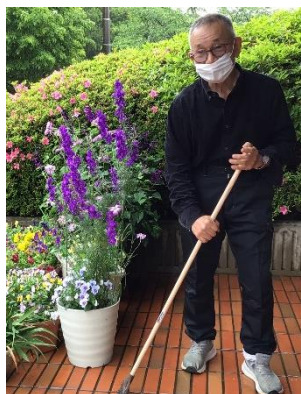
玄関をいつもきれいに