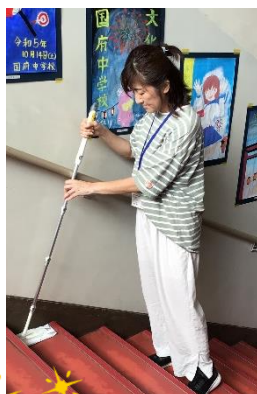
国府中の階段にホコリなし