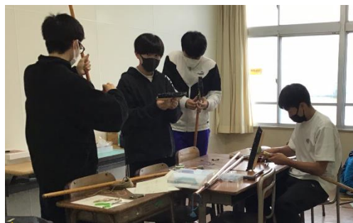
掃除用具の手入れをする 環境委員