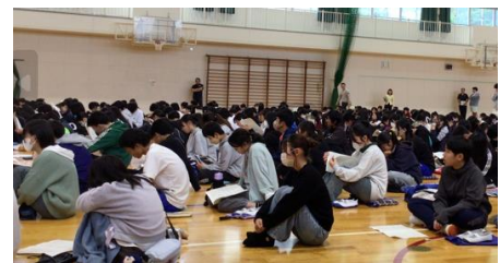
全校で、しっかり話を聞いていました